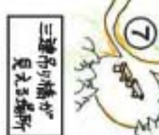
三連吊り橋が見える場所